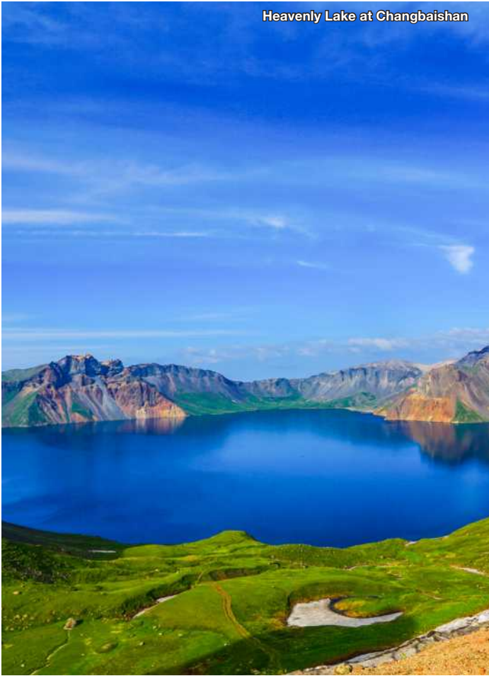
Heavenly Lake at Changbaishan